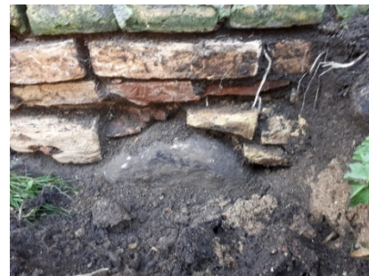
Syldsten fra Søndre Længe

SORGENFRI TEATERFORENING PRÆSENTERER SAMMEN MED KULTURSTEDET LINDEGAARDEN: